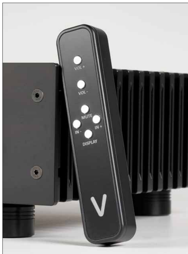
Das leuchtende Vorbild einer mustergültigen Fernbedienung: extrem solides Metallgehäuse, sorgfältig verschraubt, handlich und rutschfest abzulegen. Dazu eine sinnvolle Anzahl von Schaltern aus Metall mit definiertem Druckpunkt und fingerfreundlichem Abstand zueinander

der rutschhemmenden GummifüÙe liegt sie sicher auf der Ablage. Warum ich der Fernbedienung so viel Aufmerksamkeit schenke? Ich finde es inadäquat, Geräte, die mehrere Tausend Euro kosten, mit den üblichen Plastikriegeln auszustatten, und freue mich über die raren Ausnahmen.