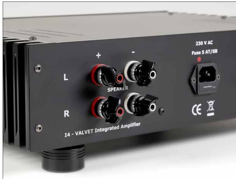
WBT-Polklemmen der neuesten Generation – auch an dieser Stelle ist das Beste gerade gut genug.

Leistung von 40/70 Watt an 8 bzw. 4 Ohm. Die im Vergleich zu den Valvet 4.5 etwas geringere Leistung sei im Wesentlichen durch die reduzierte Kühlkörperfläche bedingt. „Schnelle“ 60-A-Typ-Gleichrichterdiode und Verkabelung aus reinem Silber sorgen dafür, dass die Signale ungebremst durch die Schaltung fließen. Zwischen den vier Line-Eingängen und den Endstufen kümmert sich der Pegelregler mit nur einem Z-Foil-Widerstand im Signalweg um die in 64 Stufen einstellbare Lautstärke. Der Pegel lässt sich äußerst feinfühlig regulieren. In seiner Vorstufe Soulshine 2 MKII setzt Cornils den gleichen Regler ein. Diese Lösung hatte mich schon beim Test